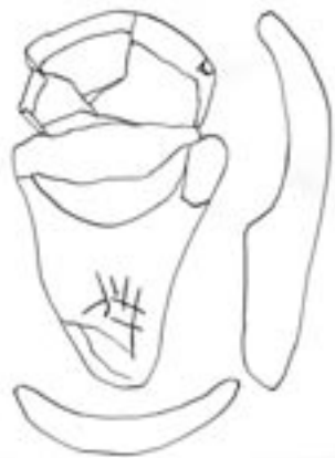
Fig. 2 : Lampe de la grotte des Scilles (Haute-Garonne). Magdalénien moyen. MAN. Grès rouge tendre à grain fin légèrement micacé. Longueur : 200 mm ; larg. max. : 108,2 mm ; diamètre de la cuvette : 101,6 mm ; profondeur : 22 mm.