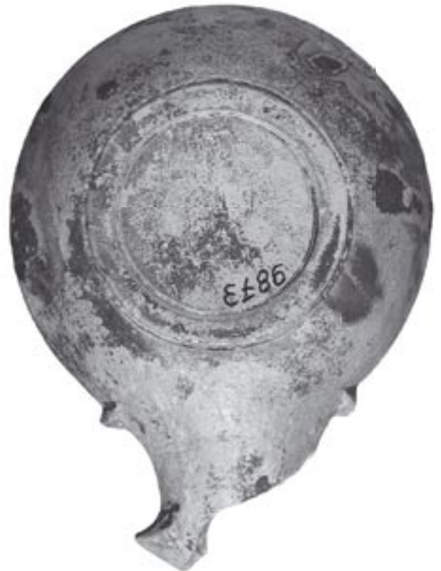
Fig. 1 - 9873 - b