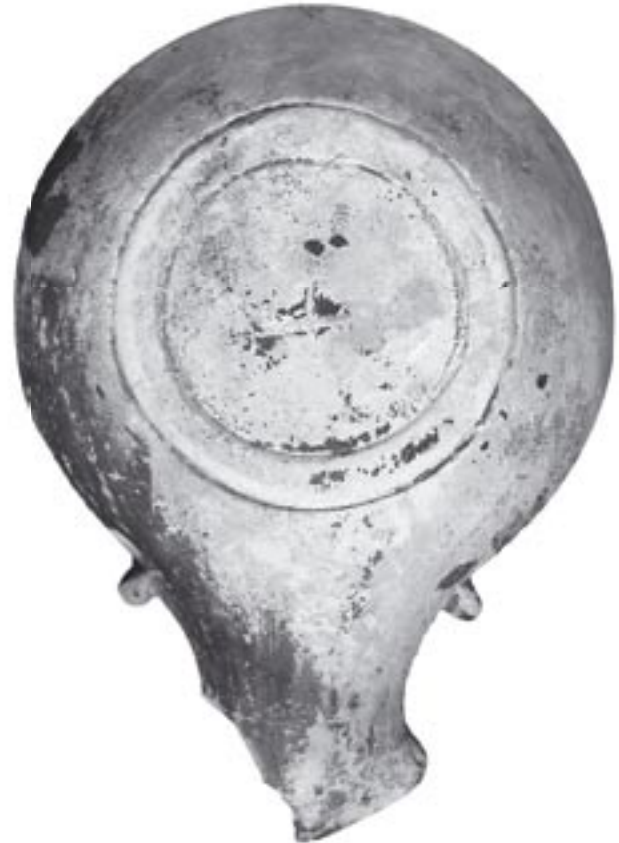
Fig. 4 - 9888 - b