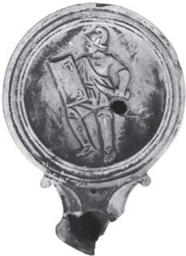
Fig. 4 - 9888 - a