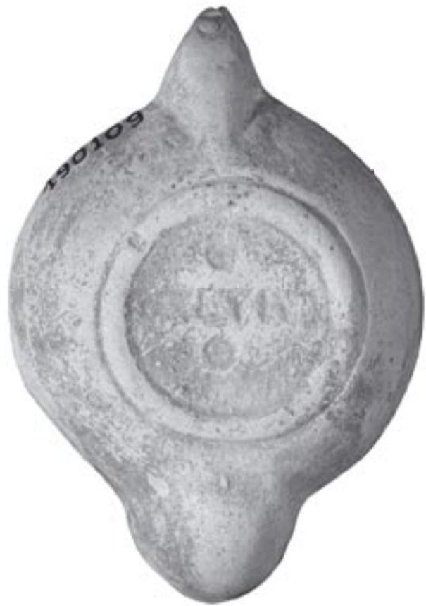
Fig. 12 - 190109 - b