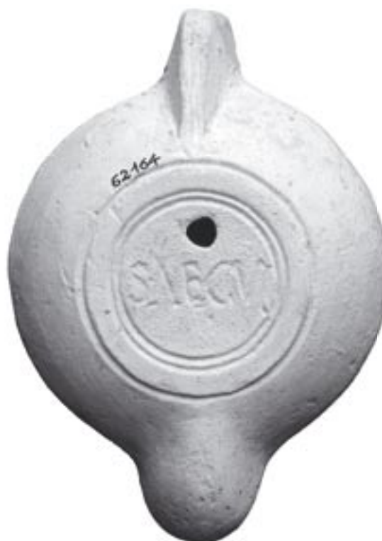
Fig. 22 - 62164 - b