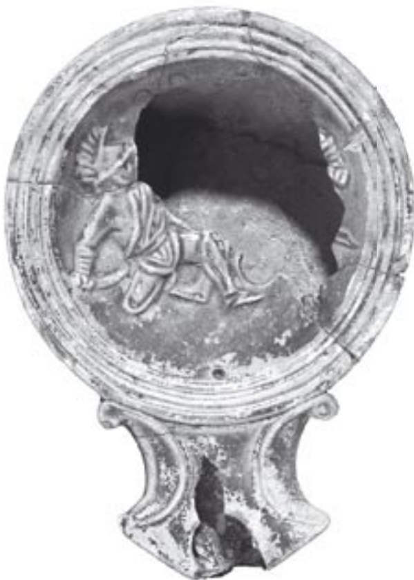
Fig. 6 - 9919 - a