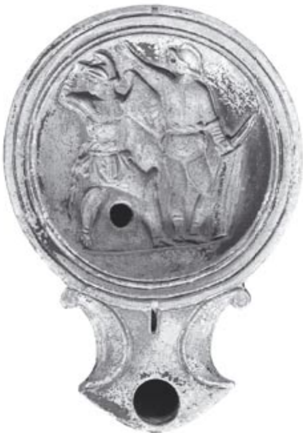
Fig. 2 - 9876 - a