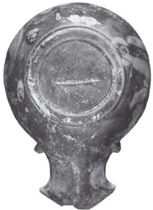
Fig. 6 - 9919 - b