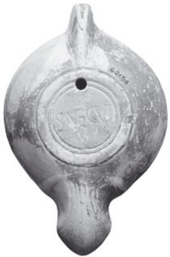
Fig. 17 - 62154 - b