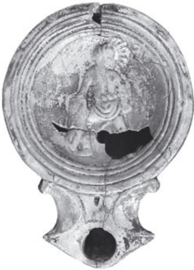
Fig. 3 - 9881 - a