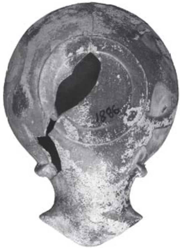
Fig. 3 - 9881 - b