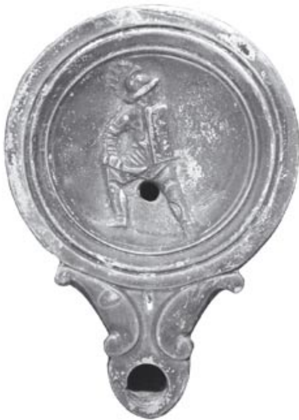
Fig. 5 - 9912 - a