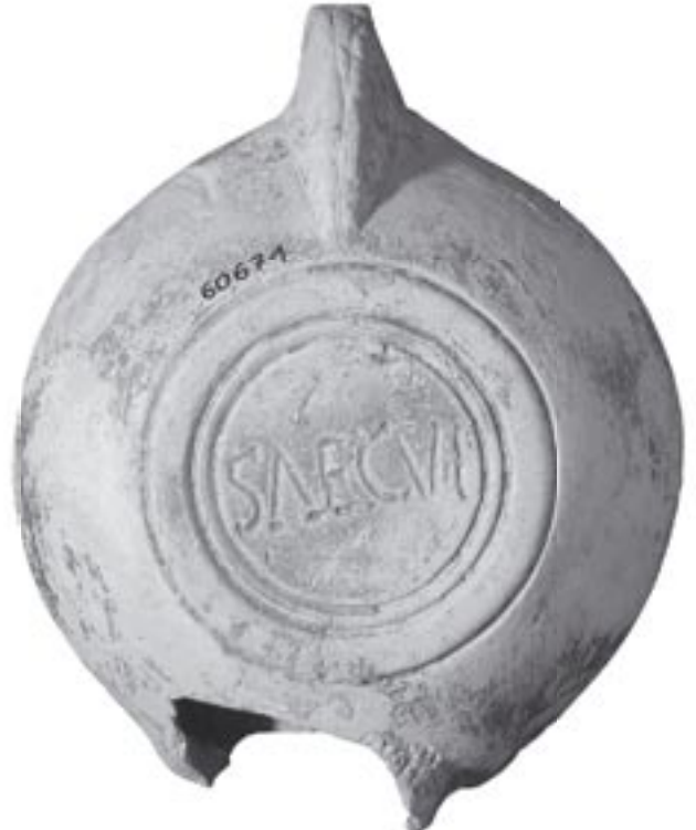
Fig. 18 - 60671 - b