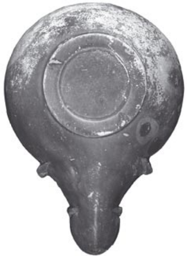
Fig. 5 - 9912 - b