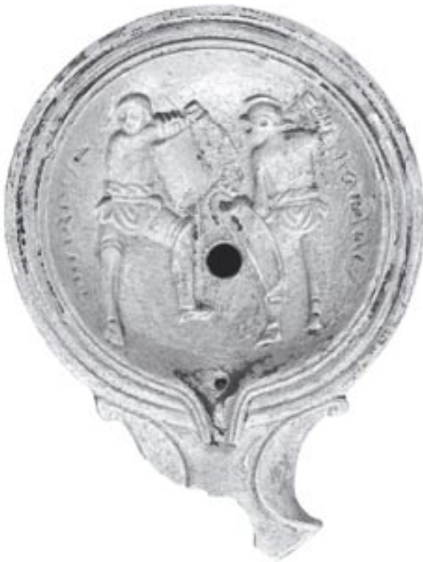
Fig. 1 - 9873 - a