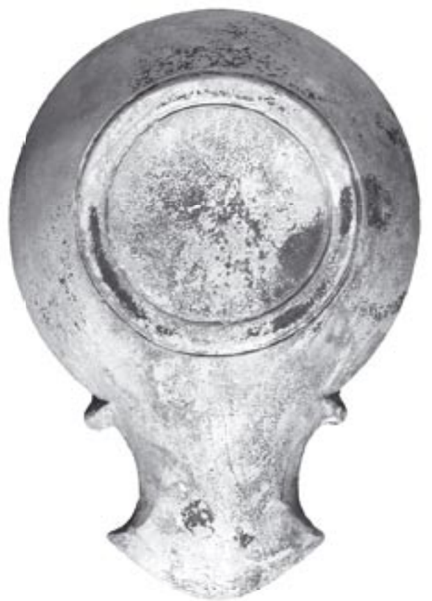
Fig. 2 - 9876 - b