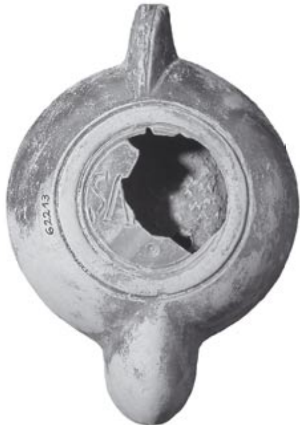
Fig. 16 - 62213 - b