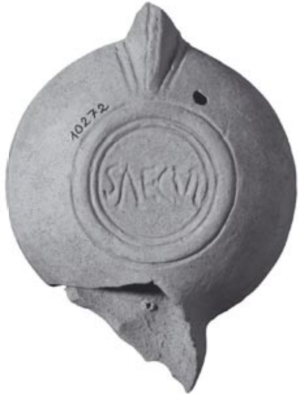
Fig. 19 - 10272 - b