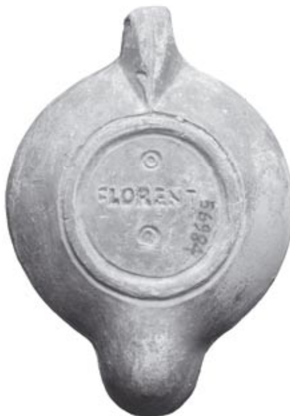
Fig. 21 - 56984 - b