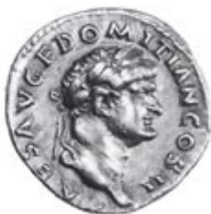
Abb. 6 AV