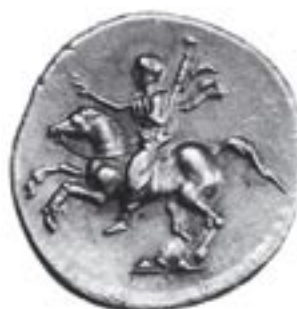
Abb. 6 RV

Abb. 4-5: Bildnis des Domitian ,1. Bildnistypus' (Rom, Museo Nazionale delle Terme, Inv. 226).