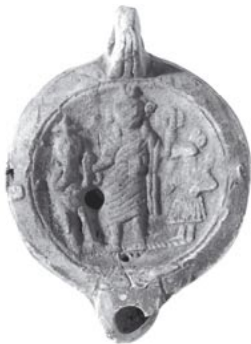
Figure 2 : Lampe S. 1927 du Louvre (Louvre AGER © EPL / Distr. RMN. Cliché Debaube)

Surtout, la lampe porte en creux la marque M OPPI SOSI. Cette marque est intéressante : en effet, elle est caractéristique de lampes italiennes 6 - et non pas africaines - du II e siècle et traduirait donc des échanges commerciaux entre l'Italie et la province d'Afrique.